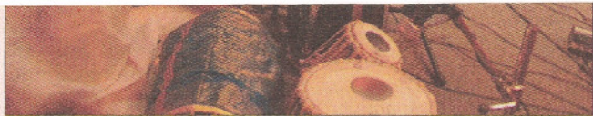
Musiciens et vocalisateurs réunionnais et indiens accompagnant les acteurs sur scène

pour elles de préserver leur culture ancestrale qui s'effrite. « Je trouve qu'à la Réunion, on est en train de banaliser le Bharata Natyam et son enseignement... On met trop tôt sur scène des élèves qui ont à peine