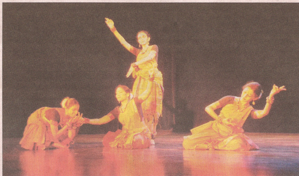
La troupe mixte présentera le même spectacle en Inde en janvier