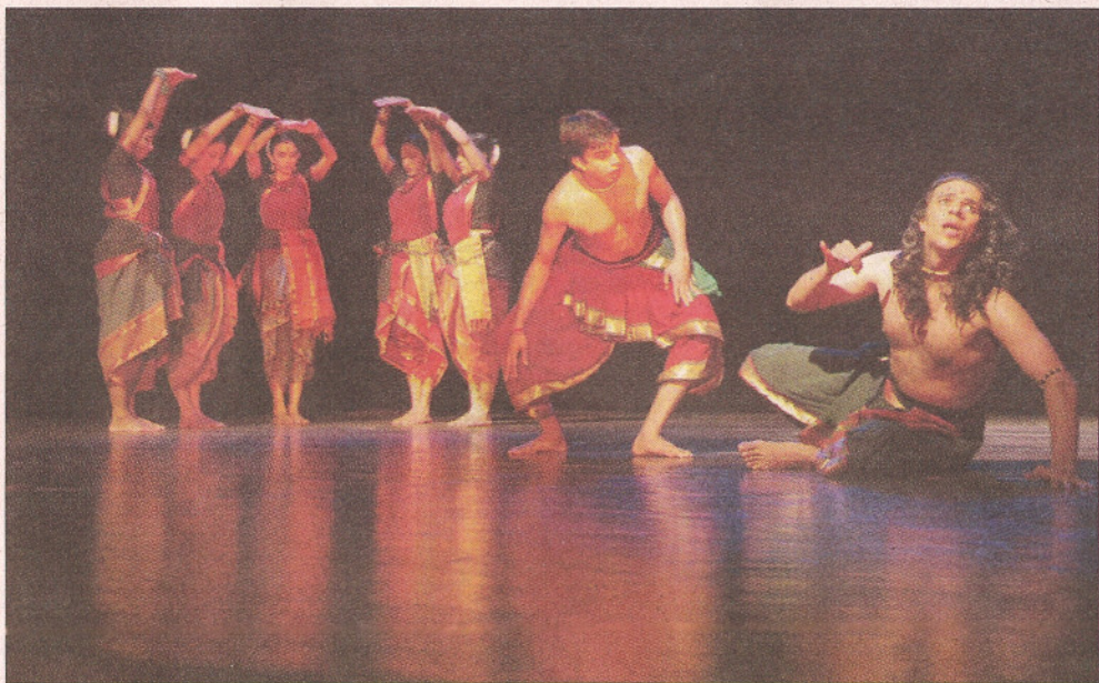
Point de paroles... Tout se passe à travers les mouvements du corps et les expressions faciales

L'association Kalâ Bhaaskara, fondée en 2003, s'est donnée pour mission d'offrir des ateliers de réflexion et d'apprentissage de la danse et de la musique classiques indiennes aux Réunionnais qui se passionnent pour « cet héritage indien constitutif du patrimoine culturel insulaire ». L'association a travaillé en étroite collaboration avec l'école Bharata Kalanjali de Chennai. Fondée en 1968, celle-ci a pour but de « préserver et de transmettre la connaissance des riches traditions, des styles et des cultures préconisés dans le Nātyashastra, Traité de danse et d'art dramatique ».